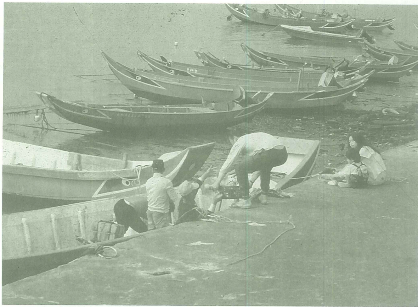
對許多人而言，下班下課後，到淡水河邊走一走已成爲一種生活方式

住在淡水的人必需認知交通是淡水都市發展的困境，是其特殊的地理條件所造成的，但是也因爲這樣的地理限制，使其在台北都會區快速發展的這幾年來，沒有發展成爲中和、板橋或是土城一樣，不斷蔓延而密集的都市建築幾乎填充所有的都市空間，生活中就是欠缺一個可以提供放鬆的「開放空間」；生活其中你很難分辨出自己所居住所在的特色。如此看來，這樣的限制條件正是淡水作爲居住所在的潛力，讓淡水有一些喘息的生活空間。但是爲了交通，我們必需尋找替代的解決方式，捷運系統其實是淡水交通的出路，利用區內的中小型接駁公車與捷運結合成一個公共運輸網路。這樣的思考方式不是將交通問題簡化成爲「車流量」與「道路