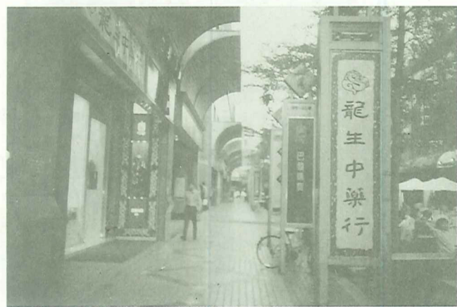
台中精明街的規劃是很好的模範（上、下）

一份特有的鄉土情懷引導著我，在一次「社區總體營造研習活動」的參與中，禁不住自己思維的跳躍，而全然跨進了「過往」「今日」以至於「未來」的時空中，反覆的盪漾著。